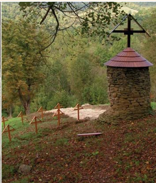
Vďaka podpore budú môcť v tomto roku pokračovať práce na úprave areálu veľkopoľanskej kamennej rotundy.