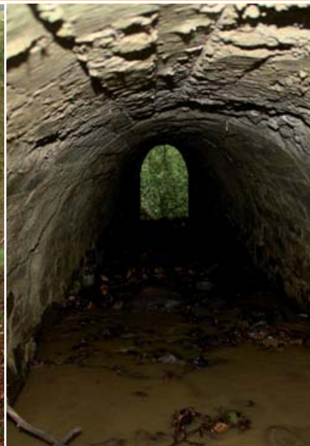
Kamenný priepust na Šponármi