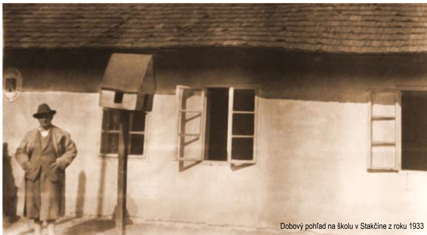
Dobový pohľad na školu v Stakčíne z roku 1933

V jari 2011 čaká OFK náročná práca, nakoľko sa na VsFZ pripravuje reorganizácia. Aj napriek tomu chce výbor OFK spolu s hráčmi zachrániť pre Stakčín V. ligu a hrať futbal pre fanúšikov s čo najlepšími výsledkami. Výbor OFK - AGRIFOP sa touto cestou chce poďakovať všetkým hráčom, trénerom a všetkým, ktorí sa podieľali na chode OFK. Všetkým veľa šťastia, zdravia.