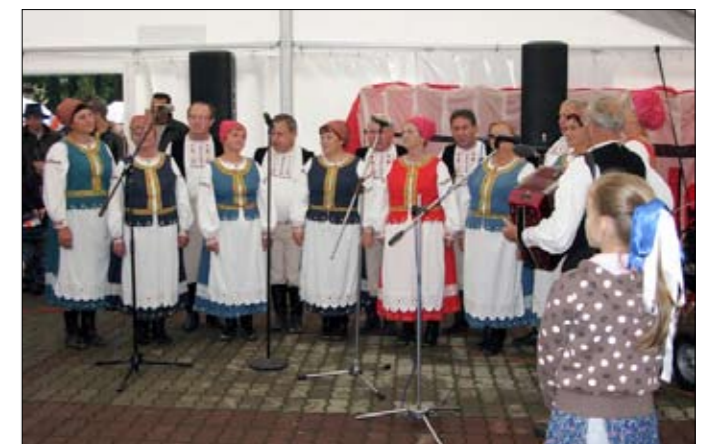
Beskyd spieval, ale aj varil miestne dobroty