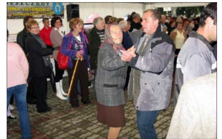
Hudba roztancovala všetky vekové kategórie