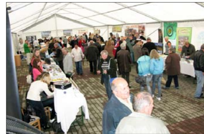
Nový stan, bude slúžiť občanom obce, na rôzne podujatia