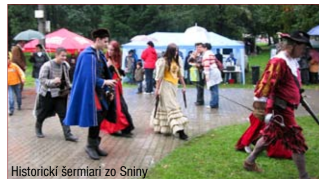
Historickí šermiari zo Sniny