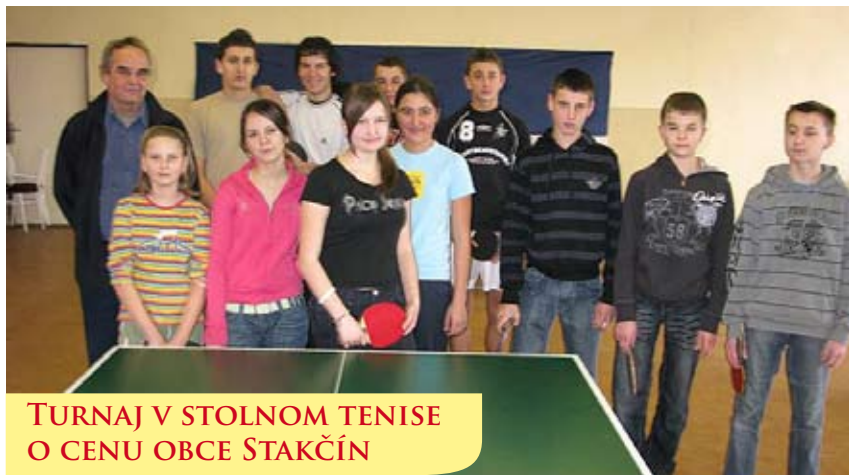
TURNAJ V STOLNOM TENISE O CENU OBCE STAKČÍN